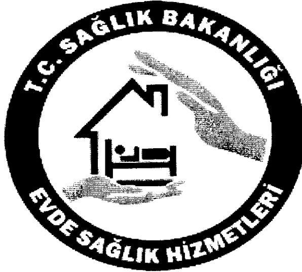
Şekil 2. Evde Sağlık Hizmetleri Logosu